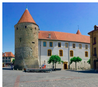
Château Yverdon-les-Bains

L'AGENCE ROULE MA POULE PROPOSE UN SERVICE DE TRANSFERTS ET NAVETTES TOURISTIQUES LE LONG DU PARCOURS DE LA VIA SALINA À PIED OU À VÉLO.