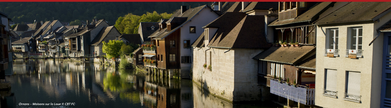
Ornans - Maisons sur la Loue