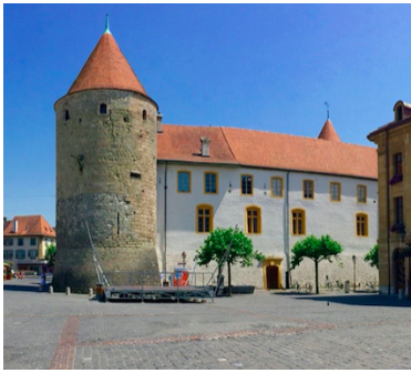
Schloss Yverdon-les-Bains

DIE AGENTUR ROULE MA POULE BIETET FÜR WANDERER UND RADFAHRER EINEN TRANSFERT- UND SHUTTLESERVICE ENTLANG DER STRECKE DER VIA SALINA.