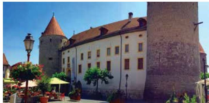
Château d'Yverdon-les-Bains