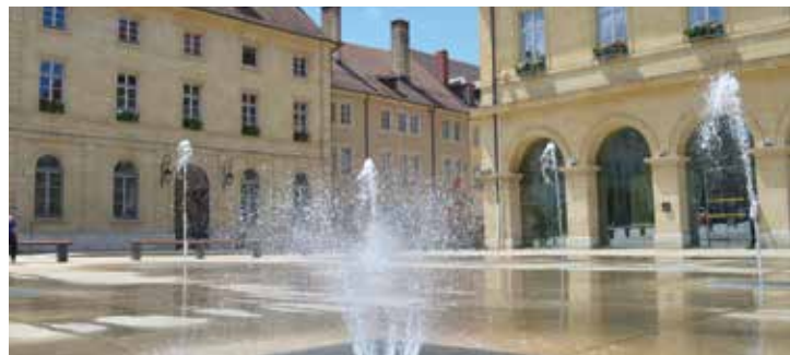
Place d'Arçon, Hôtel de ville, Pontarlier - ©Maud Humbert