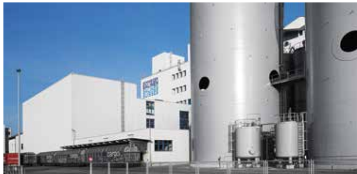
Saline de Riburg