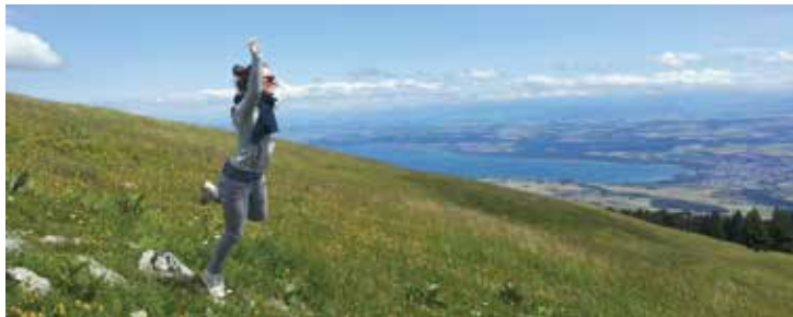
Panorama - Sainte-Croix / Les Rasses - ©Anne Bornand