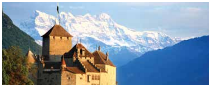
Château de Chillon