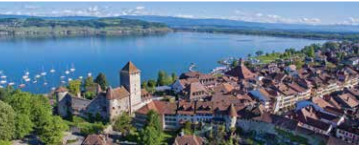
Ville de Murten / Morat

Morat, charmante ville moyenâgeuse, invite à flâner sous ses arcades ou le long des rives du lac. En découvrant ses ruelles pittoresques, ses remparts accessibles et uniques en Suisse ou ses magnifiques maisons patronales, vous avez la possibilité de voyager dans le temps : imaginez des caravanes et des baraques chargées de sel longeant le lac. Découvrez aussi le Papiliorama, jardin tropical situé à Kerzers, Le Vully, plus petite région viticole de Suisse et parcourez la région du Lac de Morat en bateau, en vélo ou en roller sur ses kilomètres de piste balisés et sécurisés.