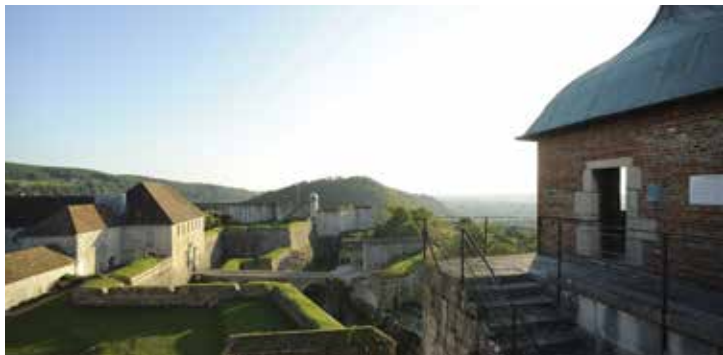
Citadelle de Besançon