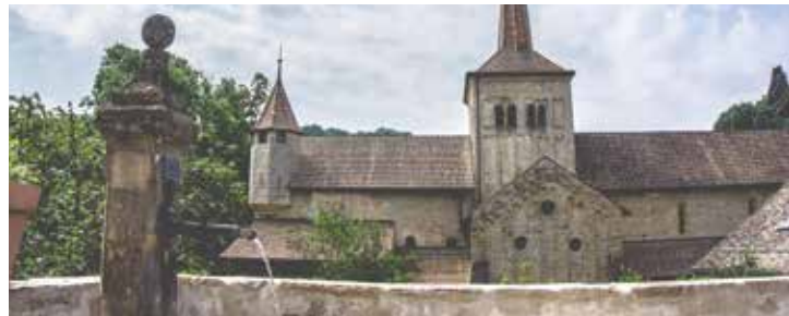
Abbatiale de Romainmôtier