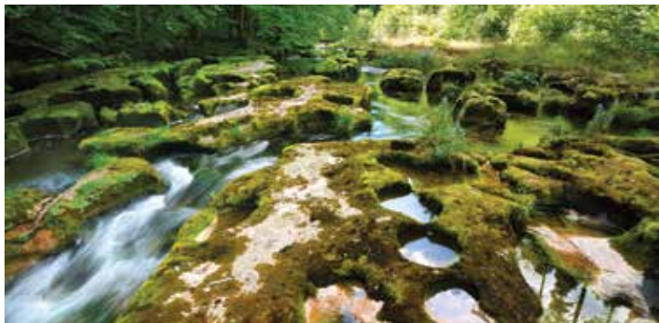
Les gorges de l'Orbe