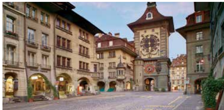
Tour de l'Horloge, Berne