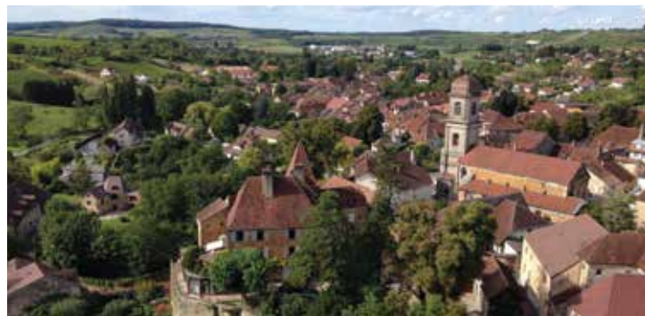
Ville d'Arbois