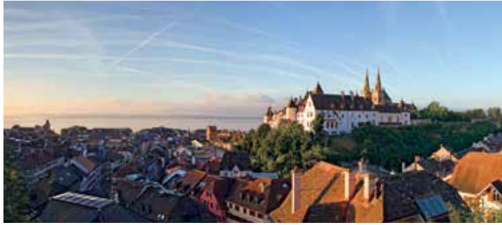
Ville de Neuchâtel