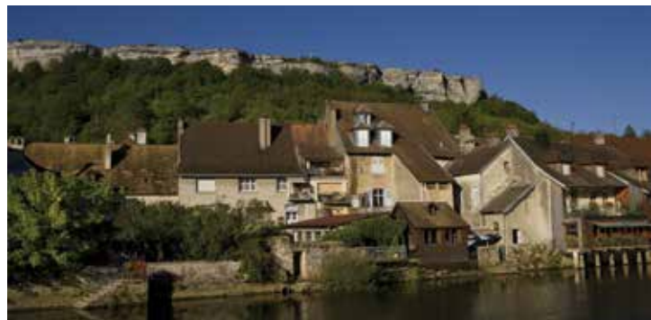
Maisons sur la Loue