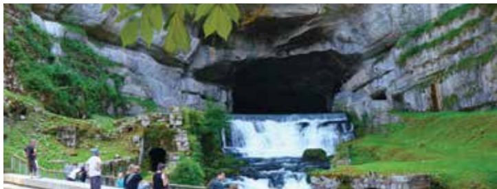
La source de la Loue - ©DoubsTourisme_LizMillereau