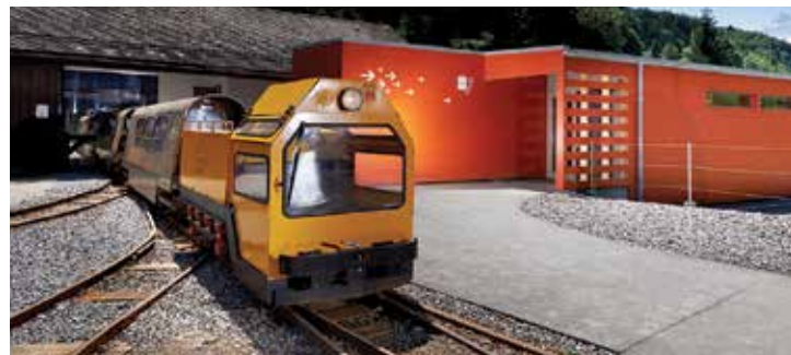
Mines de Sel de Bex