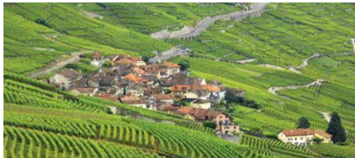
Vignobles de Lavaux