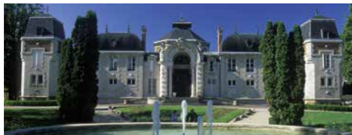
Thermes Lédonia, Lons-le-Saunier