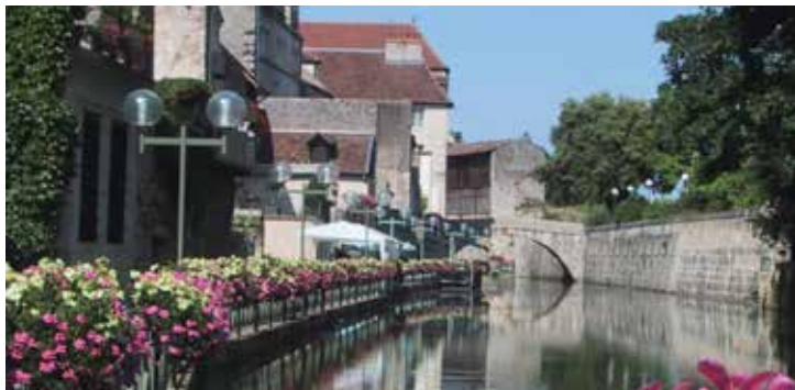
Ville de Dole