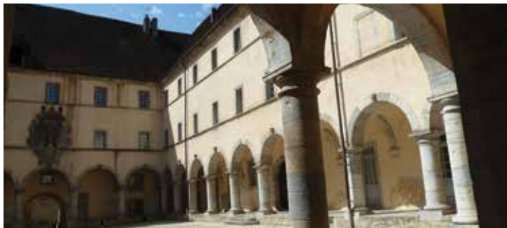
Couvent des Ursulines, Poligny