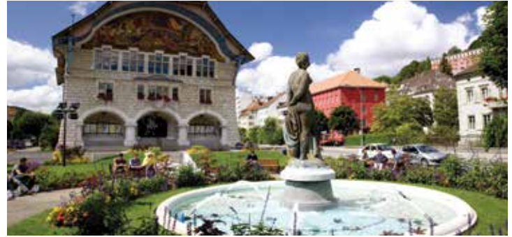
Hôtel de ville de la Chaux-de-Fonds