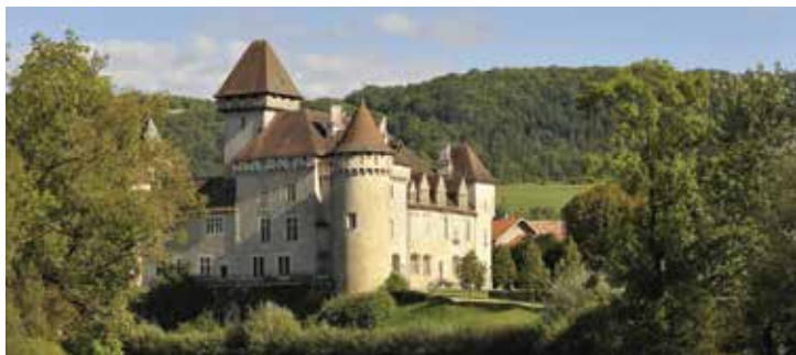
Château de Cléron