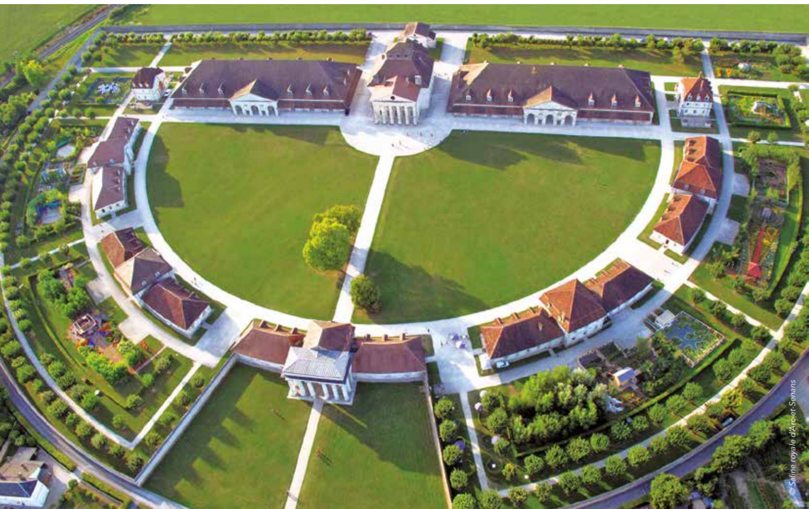
Vue aérienne de la Saline royale d'Arc-et-Senans.