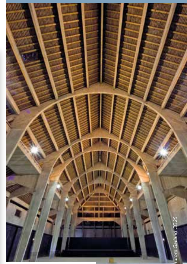
Vue intérieure d'une Bernie.

Site BPF du Doubs déjà paru dans Cyclotourisme - Saint-Point-du-Lac - juillet 1994