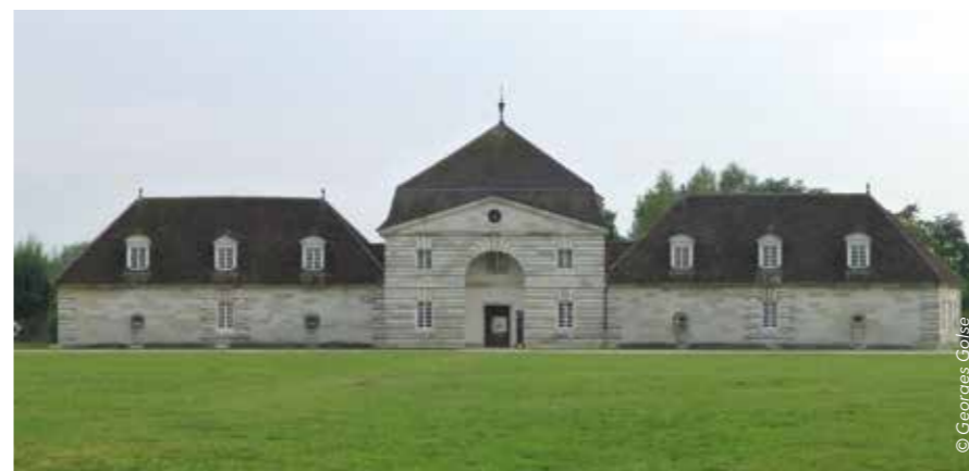
La tonnellerie qui abrite le musée Ledoux.

En dehors des bâtiments évoqués, le visiteur peut découvrir : les écuries, les bâtiments des sels - Berne est et ouest, les commis est et ouest qui abritaient les commis des gabelles - les gabelous, la tonnellerie, le bâtiment des gardes et la maréchalerie. Ils abritent des expositions temporaires ou permanentes. L'exposition « Mémoires du Lieu » témoigne du destin de la saline. L'exposition « Histoires de sel » présente l'histoire et le fonctionnement d'une saline au XVIII e siècle. Au travers d'une soixantaine de maquettes, le musée Ledoux retrace la vie de l'architecte, son œuvre bâtie et ses projets de cité idéale. De son œuvre ne subsistent que peu de bâtiments, soit qu'ils aient été détruits par le temps et les hommes, soit qu'ils n'aient été que rêvés. Avant de quitter le site, on peut s'attarder dans la librairie-boutique spécialisée en architecture et urbanisme. Une visite qui peut alourdir les sacs ! ■