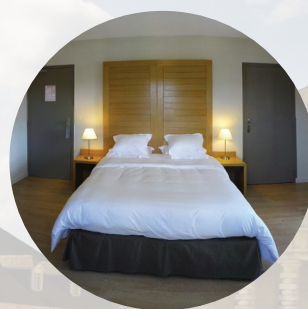
3 HAUS - GABELLE