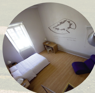
8 HÔTEL - BERNIERS