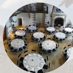
5 SALLE DE RESTAURATION