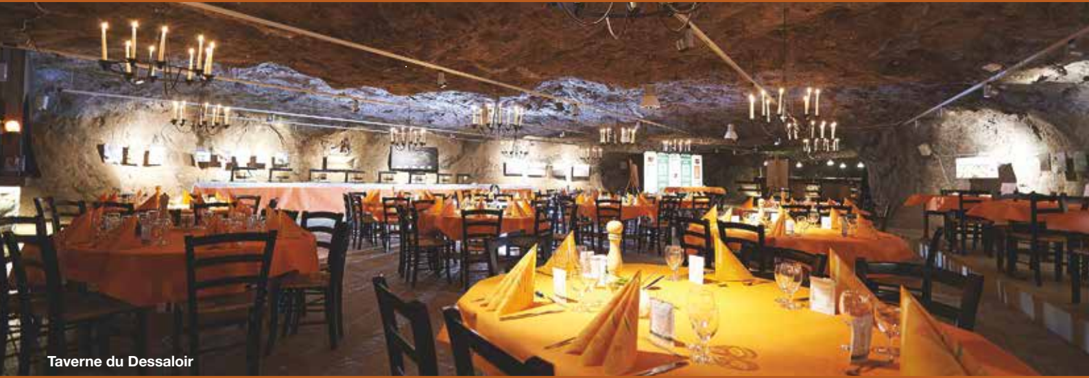
Taverne du Dessaloir