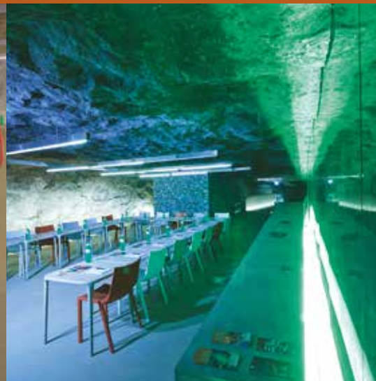
Saal Alexandre Dumas