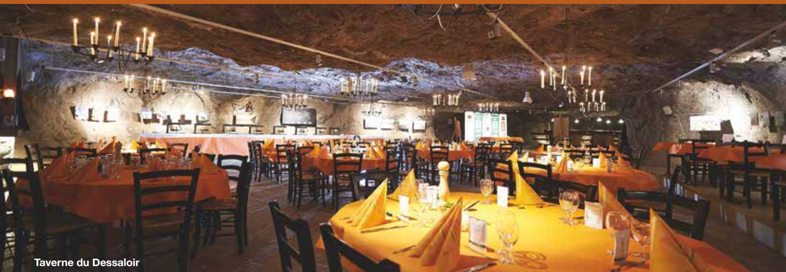
Taverne du Dessaloir