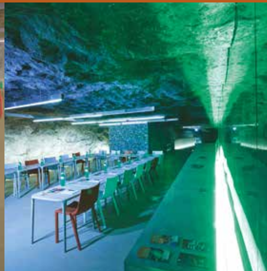
Salle Alexandre Dumas