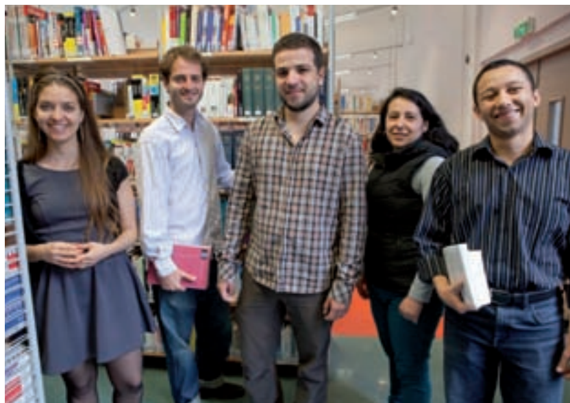
— « Victor Hugo », une bourse pour les échanges universitaires avec l'Amérique latine. —

ENSEIGNEMENT SUPÉRIEUR En juillet, 17 étudiants latino-américains viendront à Besançon préparer leur année scolaire 2013/2014 au sein de l'Université de Franche-Comté (UFC) grâce aux bourses « Victor Hugo ». Cette aide est accordée dans le but d'encourager les échanges universitaires avec l'Amérique latine. Elle permet notamment aux étudiants de préparer un master ou un doctorat dans notre université. Cette bourse prévoit une formation intensive en langue française en juillet et en août au Centre de linguistique appliquée (CLA) pour garantir le bon suivi des cours dès la rentrée. Les étudiants viennent étudier en Franche-Comté dans des domaines très variés tels que la psychologie, la nanotechnologie, le droit ou encore les mathématiques. Cette année, la Région Franche-Comté finance six bourses Victor Hugo.