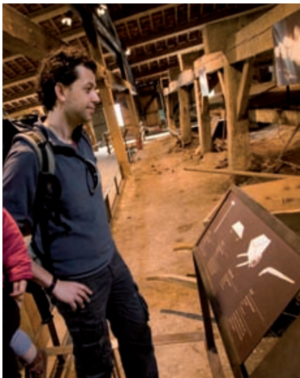
— Terra Salina, un projet visant à valoriser les salines franc-comtoises, comme celle de Salins les Bains. —

Le romain Cassiodore écrivait en son temps qu'«on peut renoncer à l'or, pas au sel». Exhausteur de saveur, manne commerciale ou motif de contrebande, vers la voisine helvète notamment, enjeu de pouvoir et monnaie fiscale, la précieuse denrée relève l'histoire de la Franche-Comté, des hommes préhistoriques à l'industrie chimique d'aujourd'hui (Solvay à Tavaux) et au thermalisme (Salins-les-Bains). Avec ses centaines de sources salées, ses parcours de randonnées thématiques (magazine « En vadrouille » 2013) et ses sites sauniers remarquables, notre région recèle un potentiel touristique patrimonial que développe le projet Terra Salina, inscrit au programme Inter-